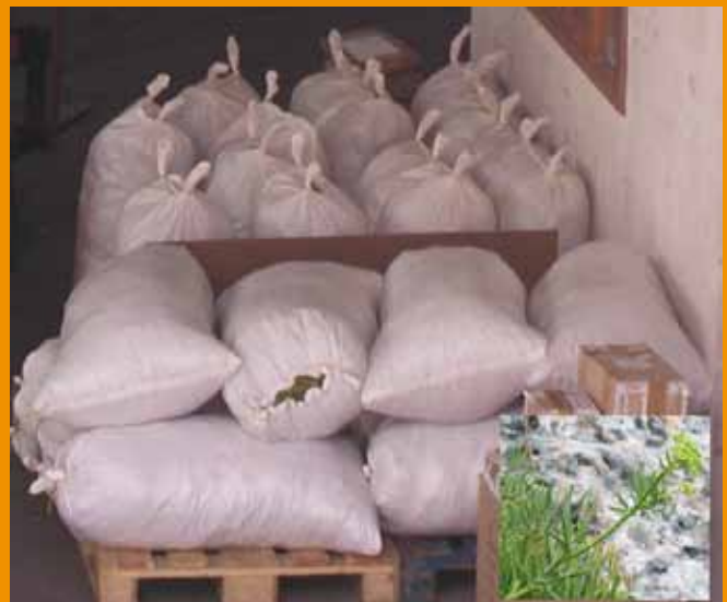
Sacs plens de fonoll marí preparats per embarcar cap a Mallorca.

Abans que sigui massa tard, el GOB proposa que es prohibeixi la recol·lecció per a usos comercials del fonoll marí silvestre. L'alternativa és potenciar les plantacions, ja que és una planta molt fàcil de cultivar. D'aquesta manera afegim un nou cultiu que ajuda a diversificar la producció agrícola a la vega da que mantenim les poblacions silvestres.