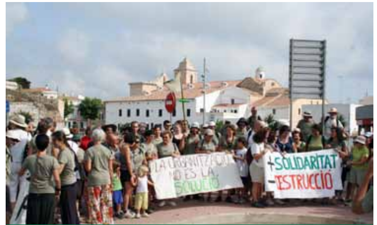
A punt d'iniciar el darrer tram cap al Consell Insular.

Escoltes de Menorca i el GOB, van adoptar algun dels trams i van portar el manifest fins a la següent estació de relleu.