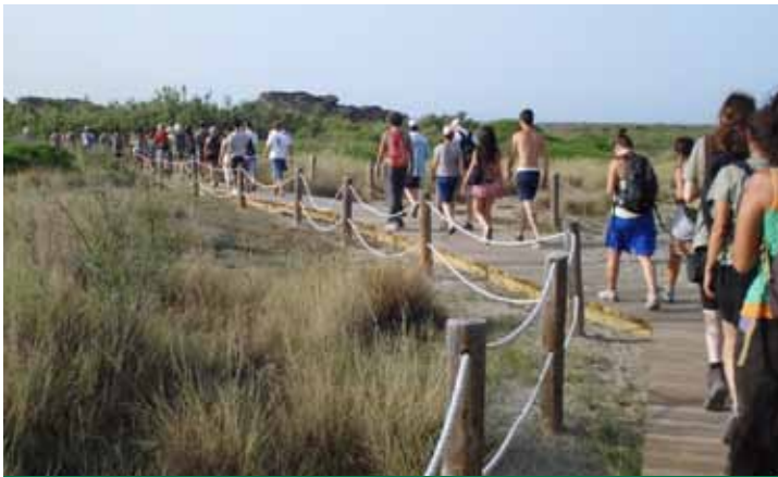
Algunes etapes van ser molt participades.