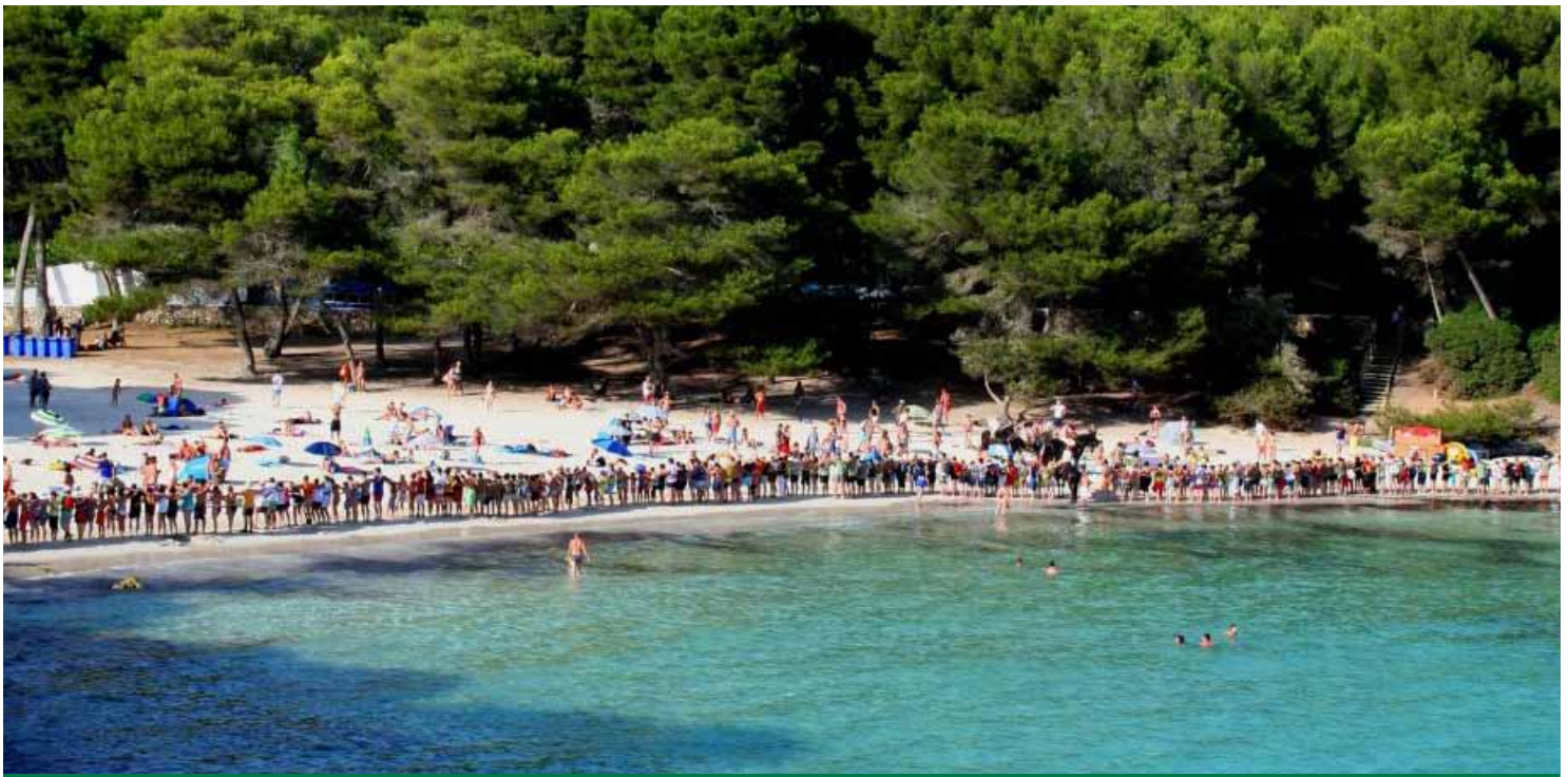
Abraçada a la platja de Macarella.